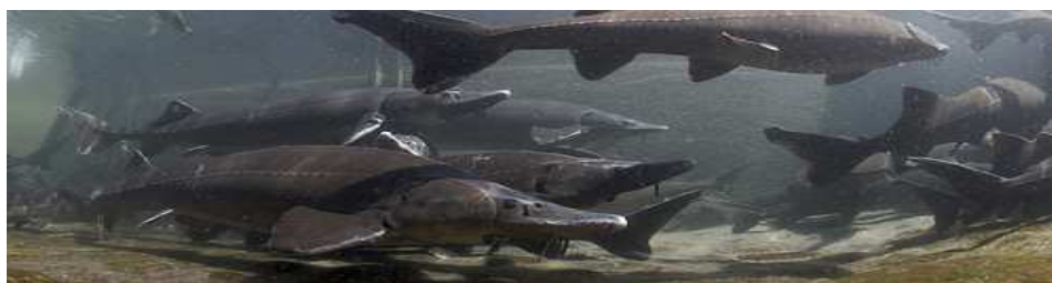
Fischzucht / Aquakultur Stör

Fisch leistet einen wichtigen Beitrag zu einer ausgewogenen Ernährung. Die weltweiten Fischbestände sind jedoch wegen der hohen Nachfrage teilweise dramatisch zurückgegangen. Eine sinnvolle Alternative zum traditionellen Fischfang im offenen Meer ist die Aquakultur – die Aufzucht von Fischen in Gehegen, die im Wasser liegen. Das Tropenhaus Frutigen leistet auf diesem Gebiet Pionierarbeit. In seinen Becken werden Sibirische Störe gezüchtet, die ein delikates Fleisch sowie die begehrte Delikatesse Kaviar liefern. Durch die Zusammenarbeit mit Wissenschaftlern wird sichergestellt, dass die Tiere möglichst artgerecht gehalten werden.