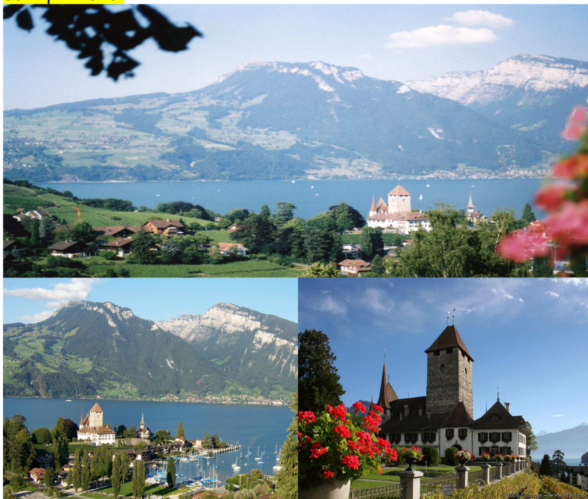
Bucht von Spiez: Aussicht vom ABZ Tagungszentrum

Ihre Anmeldung (siehe beiliegende Karte) erwarten wir gerne bis zum 30. April 2010.