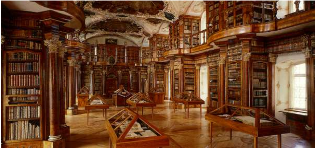
Saal der Stiftsbibliothek mit tausenden von jahrhundertealten Dokumenten

Die ca. 720 gegründete Stiftsbibliothek St. Gallen gehört zu den bedeutendsten historischen Bibliotheken der Welt. Sie gehört seit 1983 dem UNESCO Weltkulturerbe an.