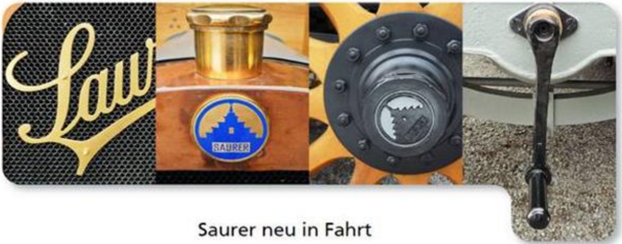
Saurer neu in Fahrt

Der Vorstand heisst alle Mitglieder der Vereinigung ehemaliger Lehrlinge VeL und ihre Begleiter zur Besichtigung und Tagung mit GV in Arbon recht herzlich willkommen. Wir hoffen auf eine rege Beteiligung an dieser Tagung 2016.